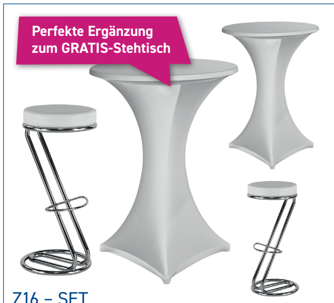
Z16 – SET