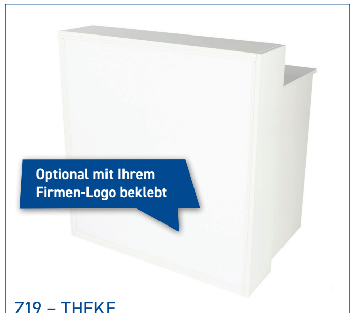
Z19 – THEKE